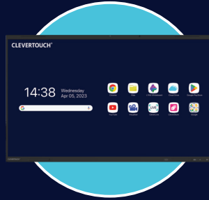
LUX for Enterprise